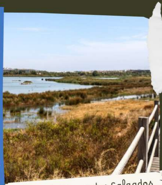
Defesa da Lagoa dos Salgados