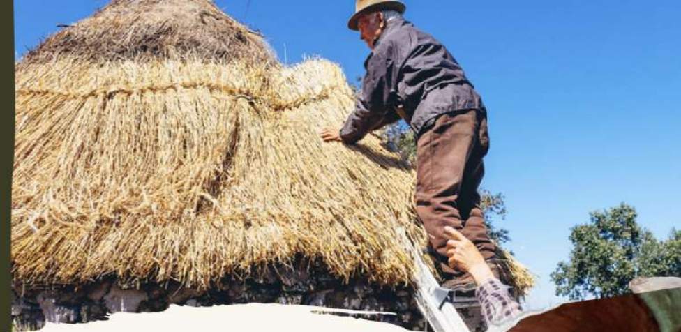
Recuperação de um palheiro no Ameixial

Como membros cooperadores da QRER temos organizado acções de recuperação de património cultural e construção sustentável.