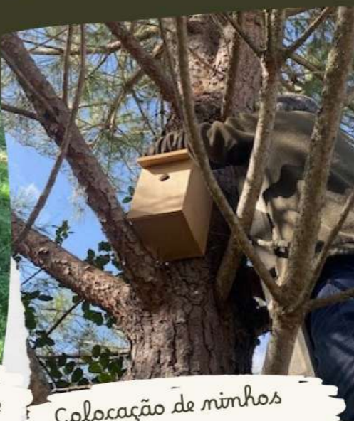
Colocação de ninhos artificiais