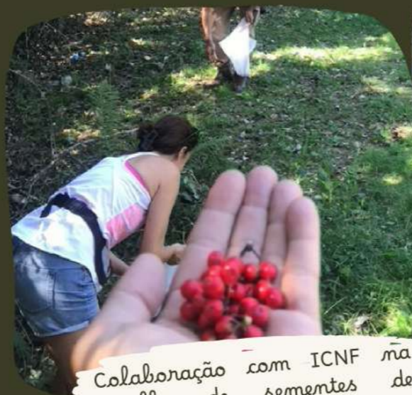
Colaboração com ICNF na recolha de sementes de carvalhos do Algarve