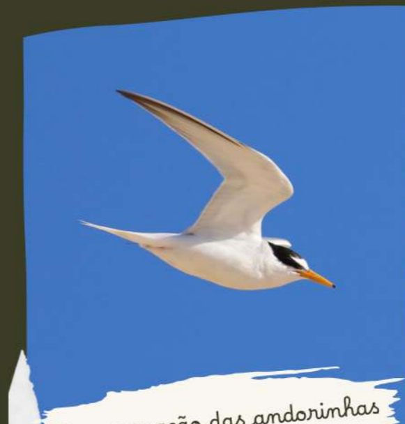
Conservação das andorinhas do mar