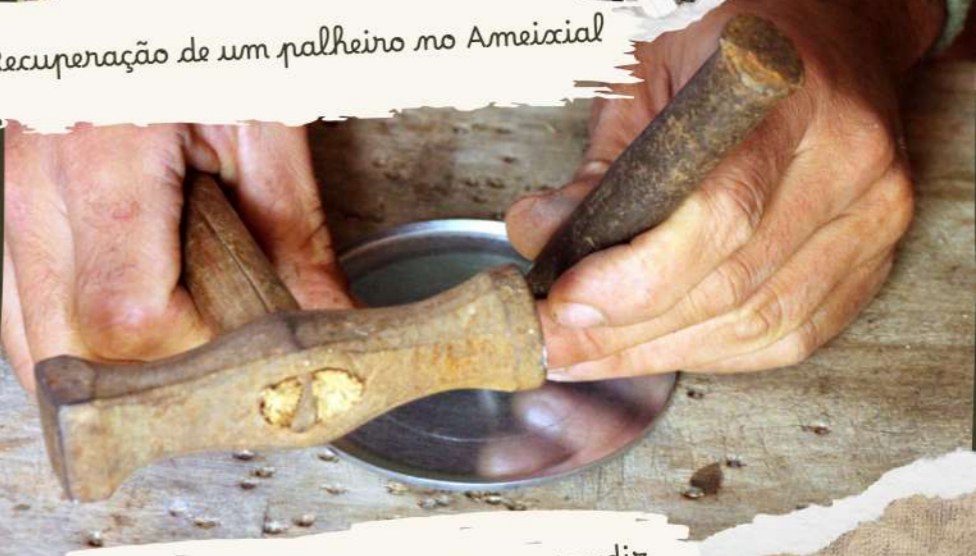
Transmissão de saberes mestre-aprendiz