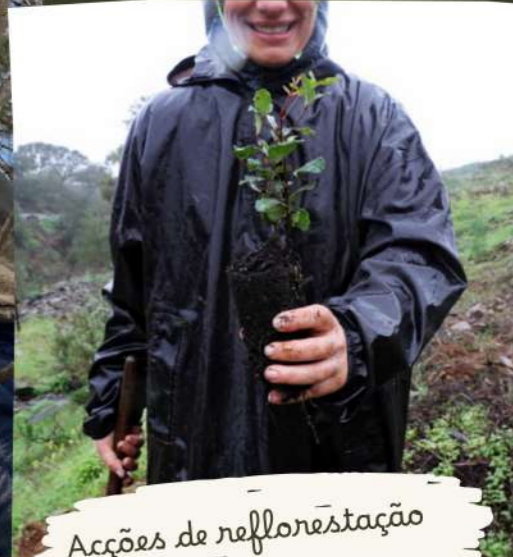
Acções de refflorestação