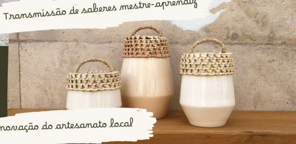
Inovação do artesanato local